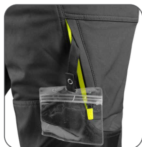
stehenní kapsa s vnitřním pouzdem na ID kartu stehenné vrecko s vnútorným držiakom na ID kartu thigh pocket with inner ID card holder kieszeń na udzie z miejscem na ID kartę