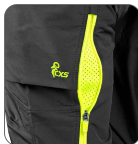
ventilace na stehně ventilácia na stehne thigh ventilation wentylacja na nogawce