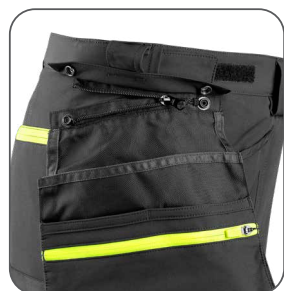
odepinací kapsy odnímateľné vrecká detachable pockets odpinane kieszenie